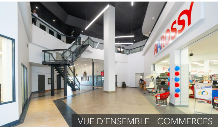
VUE D'ENSEMBLE - COMMERCES