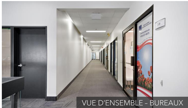
VUE D'ENSEMBLE - BUREAUX