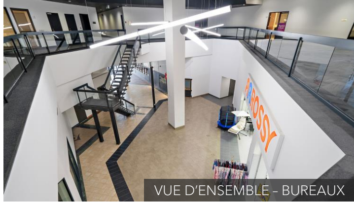
VUE D'ENSEMBLE - BUREAUX