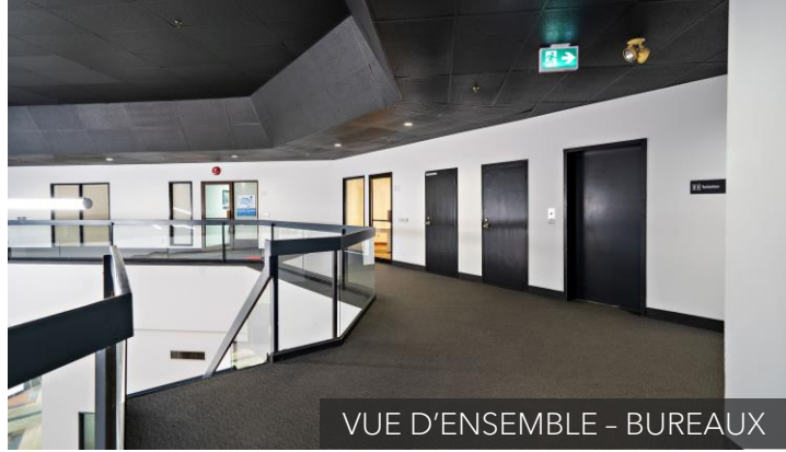
VUE D'ENSEMBLE - BUREAUX