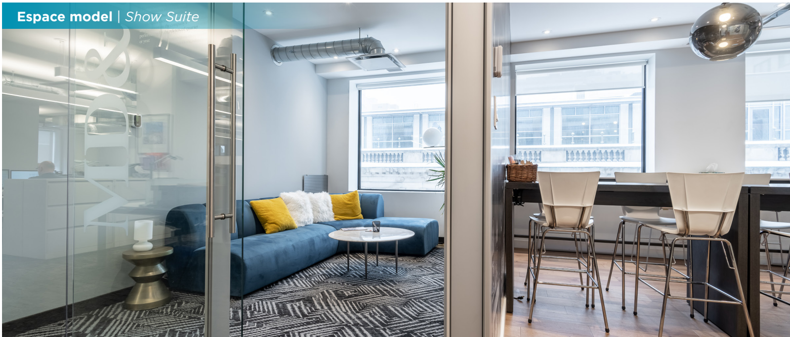
Espace model | Show Suite