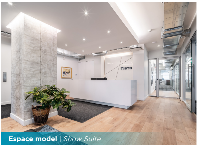
Espace model | Show Suite

Disponibilité | Availability Immédiate | Immediate