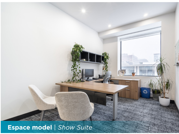
Espace model | Show Suite