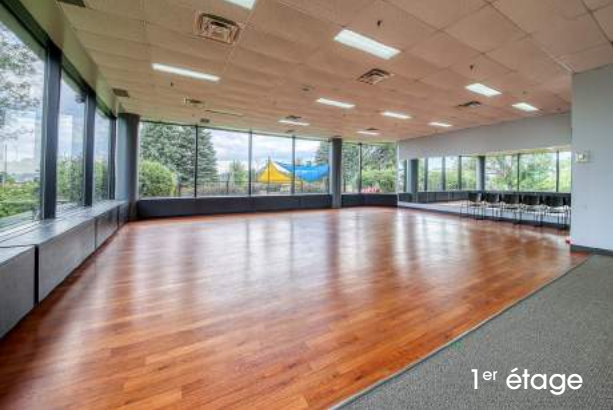
1 er étage