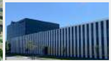
7300, rue Transcanada