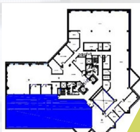
3 E ÉTAGE | 3 RD FLOOR